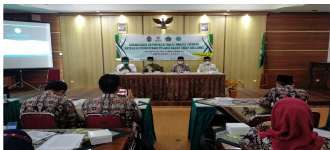
Gambar 1. Sosialisasi Sertifikasi Halal Gratis BAZNAS Kota Yogyakarta