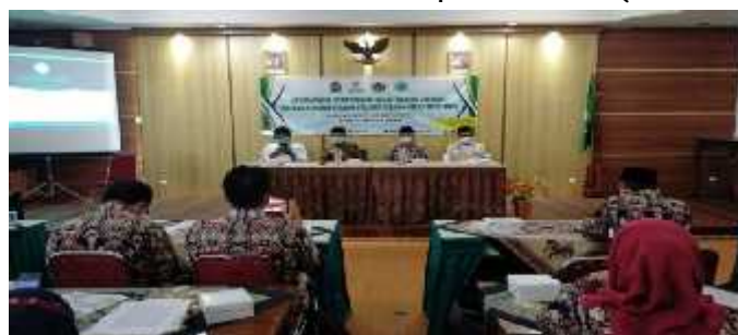
Gambar 1. Sosialisasi Sertifikasi Halal Gratis BAZNAS Kota Yogyakarta